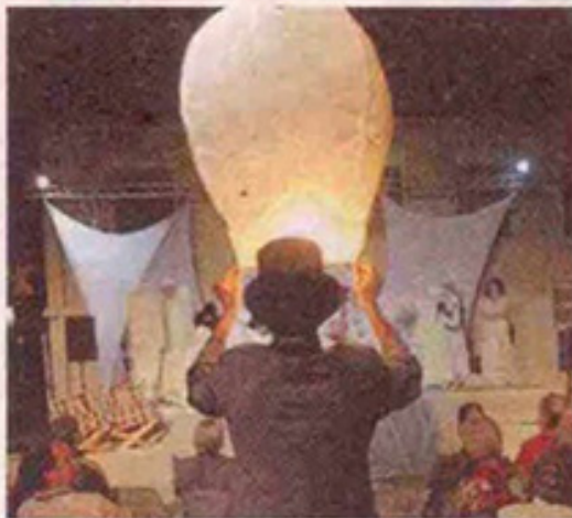
Alcuni suggestivi momenti dello spettacolo di venerdì sera

Ebbene se il progetto di Anima Mundi Creativity Factory di cui Macondo è la prima produzione era anche quello di restituire Piazza Dante alla città di Trento ebbene chi venerdì era fra il pubblico dello spettacolo si è riappropriato del parco. Nonostante nell'ombra, ai margini, il problematico popolo della notte